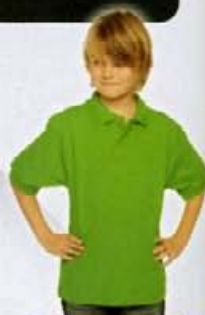
588.42 - Safran Kids